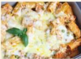
Penne al Forno