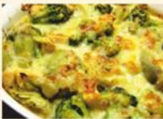
Brokkoli al Forno