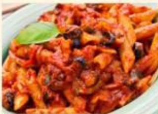
Penne al Arrabiata